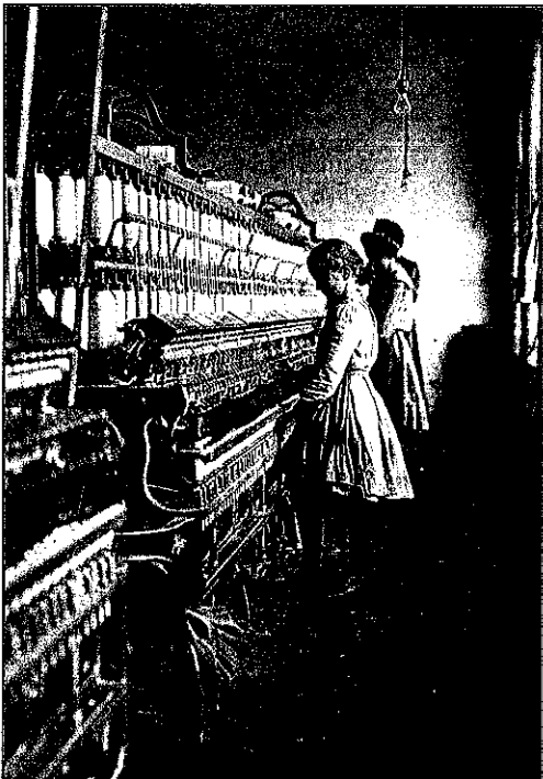
Een kind dat werkt in een fabriek.

In de negentiende eeuw werden veel arbeiders behandeld als goedkope werkpaarden. Omdat ze arm waren, woonden ze in de stad dicht bij elkaar in kleine huizen. Ze aten weinig groente en fruit en werden daardoor snel ziek. Geld voor de dokter was er niet. Heel veel kinderen stierven jong. Eerst bemoeide de regering zich niet met de problemen van de arbeiders. Maar daar kwam langzaam verandering in.