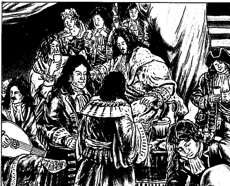
Aan het hof van Lodewijk XIV.

Koning Lodewijk XIV van Frankrijk was dol op feesten. Hij woonde in een enorm paleis in Versailles. Aan zijn hof was dagelijks wel een feest. In die tijd werd de bevolking ingedeeld naar standen. De eerste stand waren de priesters en de monniken. De tweede stand was de adel: graven, hertogen, baronnen. En de derde stand waren de burgers, waaronder ook de grote groep boeren. De burgers en boeren moesten flink belasting betalen voor de feesten, oorlogen en luxe van de koning. Onder de volgende Franse koningen stegen de belastingen verder. Het volk werd steeds ontevredener. Ze wilden meer macht en, net als de burgers in Amerika, hun eigen land regeren. De Franse burgers maakten ook een moderne grondwet. Ze wilden 'vrijheid, gelijkheid en broederschap'. In 1789 bestormden ze in Parijs de Bastille, de koninklijke gevangenis. De Franse revolutie was begonnen.