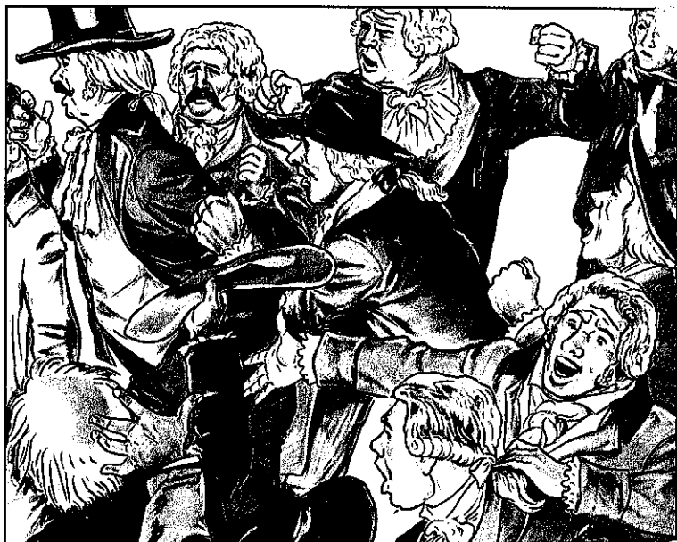
Rellietjes in Amsterdam.

De burgerij had genoeg van de macht van de regenten die in grote luxe leefden. Ze wilden zelf meer te zeggen hebben. In 1748 braken in Amsterdam rellen uit. Willem IV was toen stadhouder van alle gewesten. Deze groep ontevreden burgers noemde zich patriotten. Zij wilden geen stadhouder meer die alles besliste. Ze wilden meer democratie. Prinsgezinden vonden dat de stadhouder juist moest blijven. Ze noemden zich ook wel orangisten. In 1785 kregen de patriotten de meerderheid in de Staten van Holland. Willem V was een zwak bestuurder. Hij werd uit Den Haag weggejaagd door de patriotten en vertrok naar Nijmegen. Alleen met steun van een Pruisisch leger kon hij weer als stadhouder terugkeren. Niet voor lang.