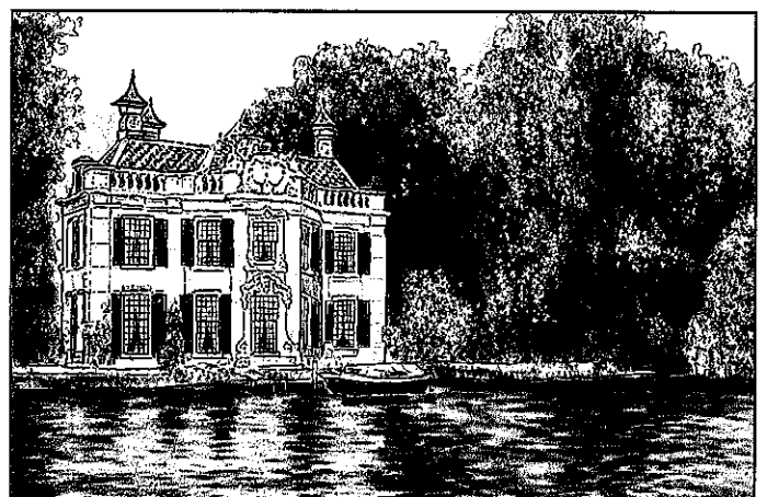
Een buitenhuis aan de Vecht.

In de achttiende eeuw had een kleine groep rijken het voor het zeggen in de Republiek. Deze regenten verdeelden de goed betaalde baantjes en bestuurden het land. Ze deden graag mee met de nieuwste mode uit Frankrijk. Hun buitenhuizen waren ingericht in Franse stijl. Niet iedereen had het zo goed als de rijken en het gewone volk met vast werk. In de achttiende eeuw waren veel mensen werkloos geworden. Zij leefden van de bedeling. De achttiende eeuw wordt ook de eeuw van de verlichting genoemd. Veel mensen wilden zich niet door de Kerk en de vorsten laten vertellen hoe alles in elkaar zat. Maar ze wilden zelf met hun zintuigen de wereld onderzoeken en zo een eigen mening vormen.