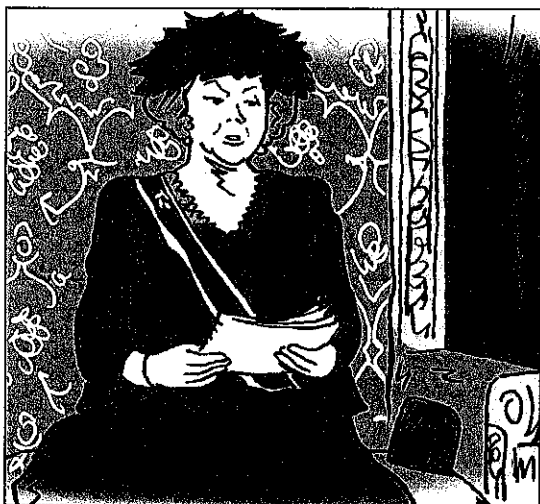
De koningin leest de troonrede voor. Daarmee opent ze de vergadering van de Staten-Generaal.

Filips de Goede stierf in 1467. Daarna werd het Bourgondische Rijk nog groter. In 1500 werd Karel V geboren. Hij werd in 1515 Heer der Nederlanden.