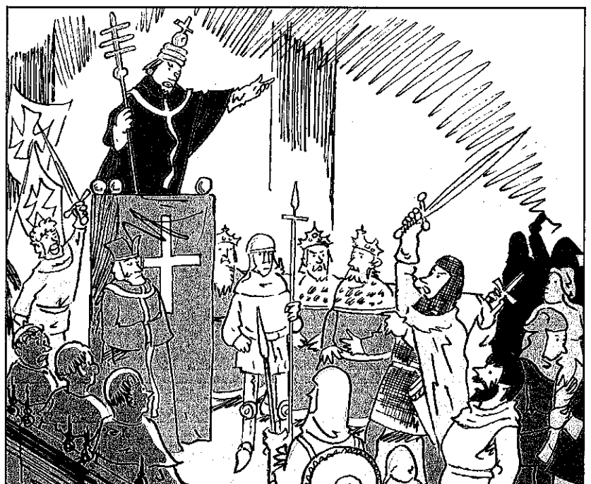
De paus vertelt dat Jeruzalem is veroverd door moslims.

In totaal zijn er zeven kruistochten geweest. Kruisvaarders die terugkwamen brachten soms dingen mee die nog niemand in Europa kende, zoals: glas, zijde, suiker en parfuum.